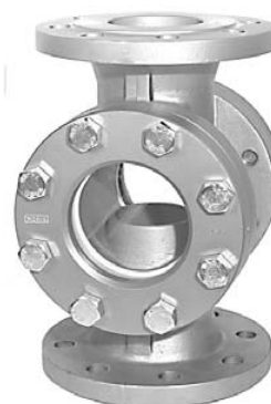
DN 65 – 250 s okrúhlu nadstavbou