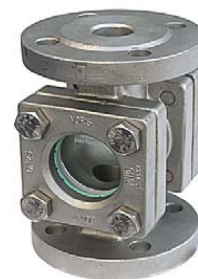
DN 15 – 50 so štvorcovou nadstavbou