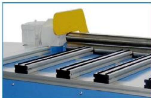
Obr.: Vyhazovač rour, pneumaticky ovládaný